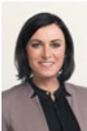
ELISABETH KÖSTINGER Bundesministerin für Nachhaltigkeit und Tourismus

Lebensmittelabfälle in Österreich sind vermeidbar! Wir alle können bereits mit kleinen Maßnahmen Großes bewirken und gemeinsam einen wesentlichen Beitrag zum Schutz unserer Ressourcen leisten.